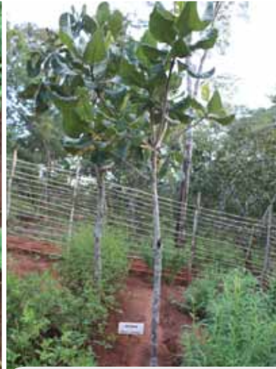
Deux exemples d'associations

même si elles se trouvent au-dessous d'autres cultures : c'est le cas des courges, qui réussissent à recueillir la lumière grâce à leurs très grandes feuilles.