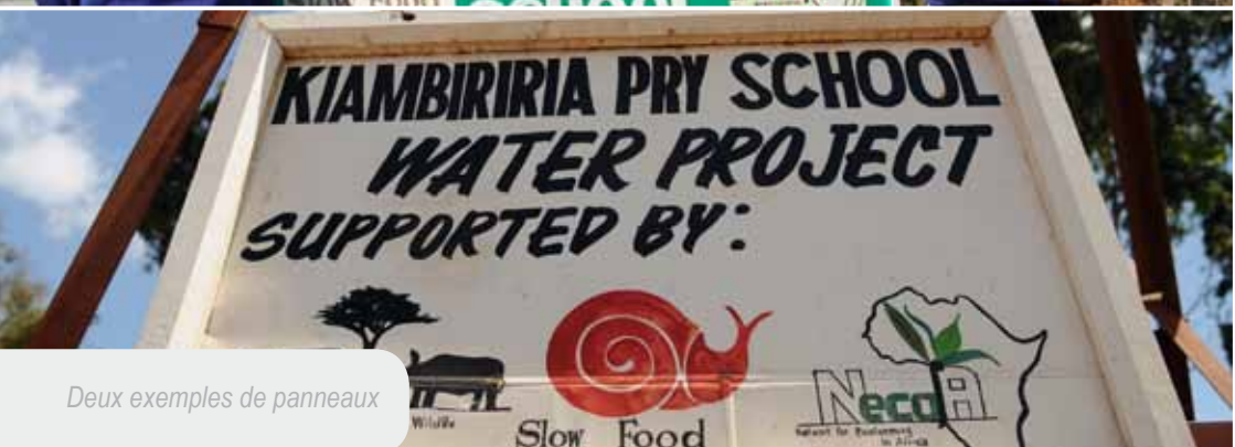
Deux exemples de panneaux