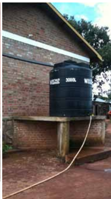
Deux exemples de récolte d'eau : un bassin et un réservoir pour la récolte de l'eau de pluie du toit (par la gouttière)